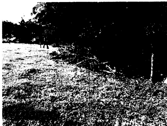
Fotos 2 y 3: Terreno sin residuos del aprovechamiento y plántulas de la compensación en buenas condiciones.