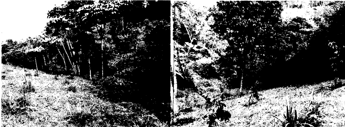
Foto 4 y 5: Siembra de especies nativas que hacen conexión con zona boscosa