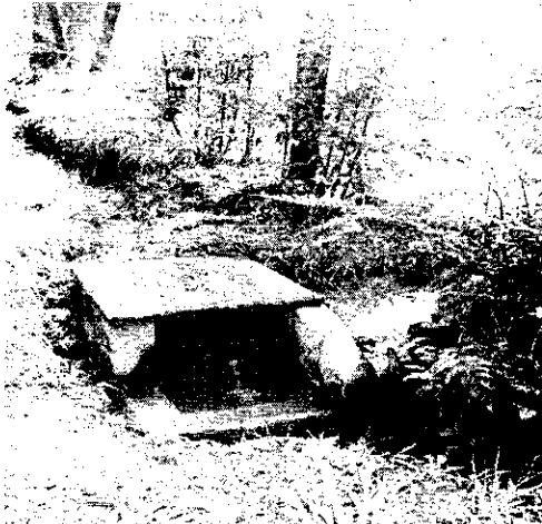
Obra de control