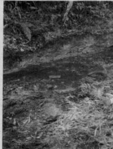
Imagen 1 tomada del SIG, Punto donde se encontraba establecido la infraestructura para la siembra de truchas.

Gestión Ambiental, social, participativa y transparente