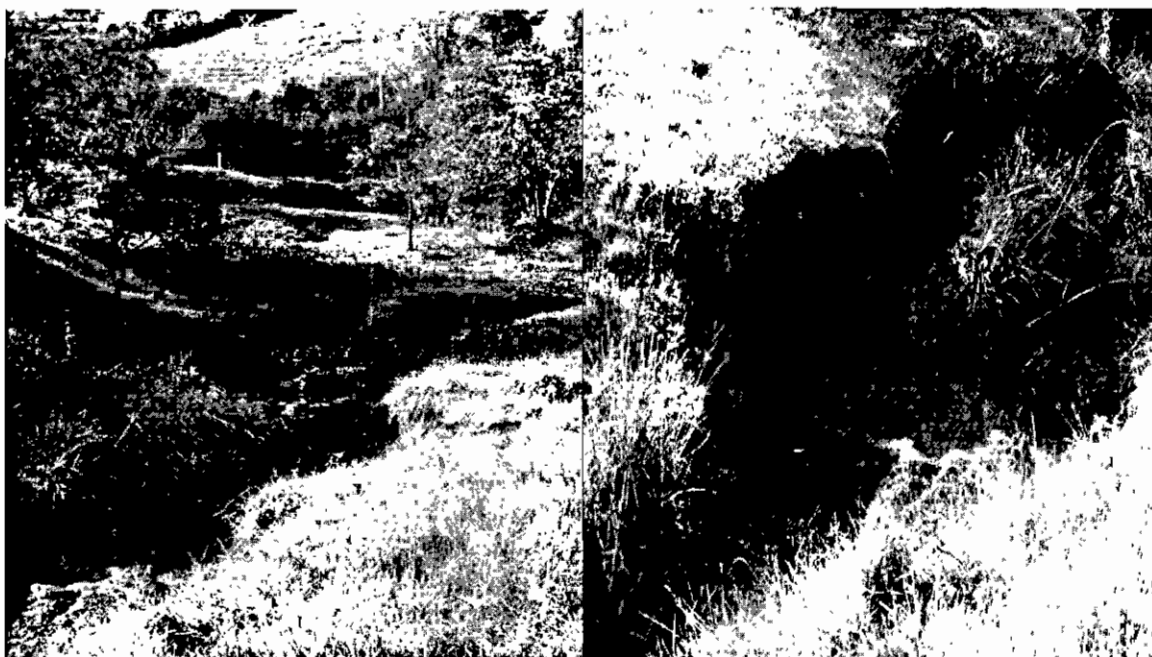
Foto 3 y 4. Estado actual del cauce en predio de la interesada, con evidencias de desestabilización de orillas.

Otras situaciones encontradas en la visita: NA