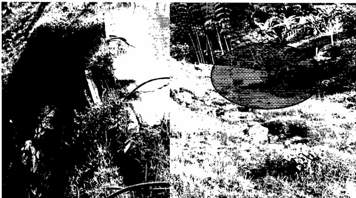
Foto 1. Mangueras, costales de suelo y pedazos de muros sin desmontar y foto 2: Muro sin demoler, inestable, y proceso erosivo activo, cerca de vivienda.

➤ Se evidencia en varios tramos del cauce de la fuente, altos procesos de socavación del mismo, con aportes permanentes de sedimento aguas abajo en periodos de lluvia.