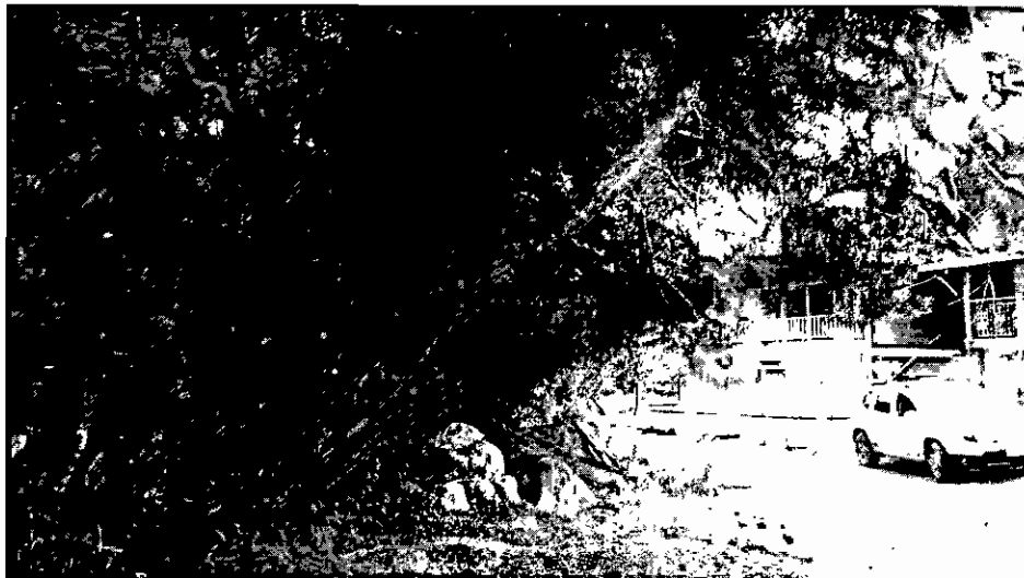
Paralelo a la Q. La Mosca