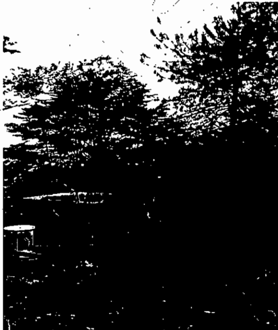
Planta de Tratamiento de agua Acueducto La Charanga

Gestión Ambiental, social, participativa y transparente