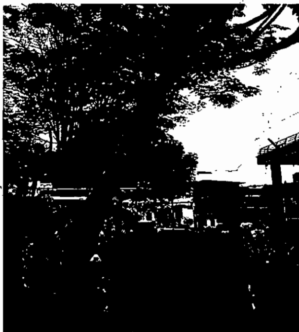
Parque Infantil San Francisco