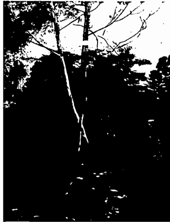
Puente entre Industrias Cadi y Senco Colombiana Puente cerca de las Canchas del Club Atlético Nacional