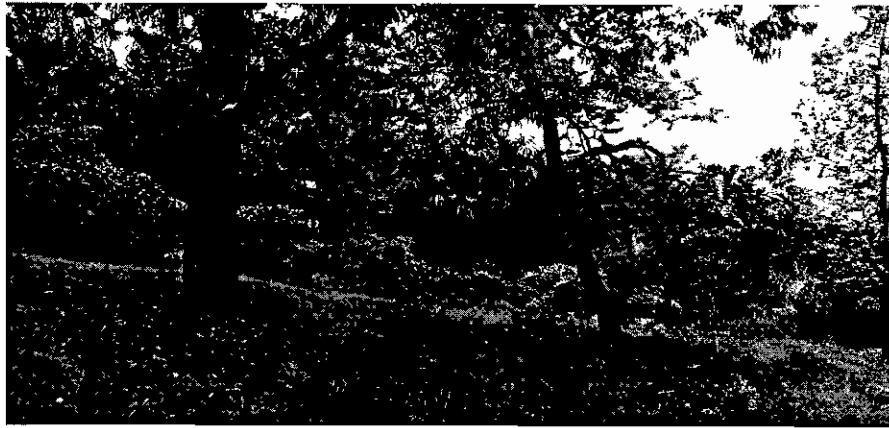
Institución Educativa Romeral