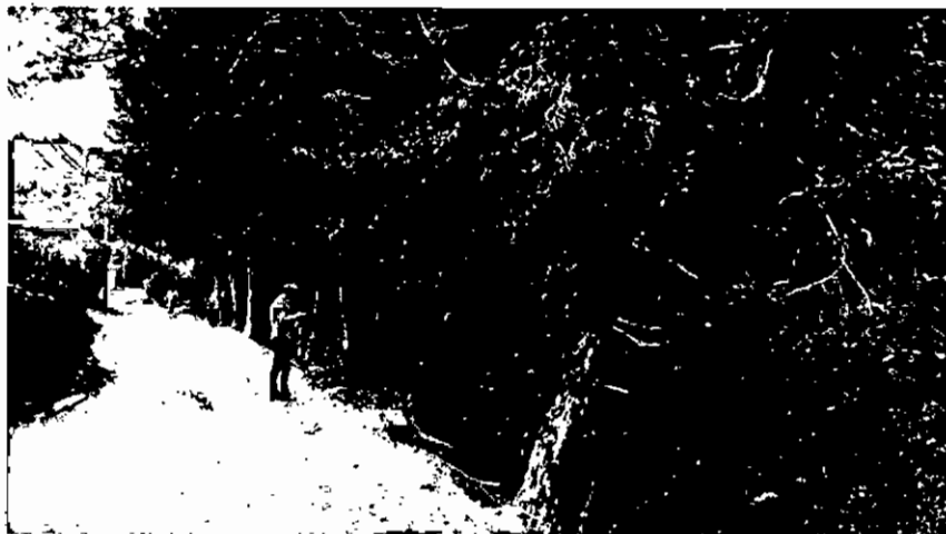
Sector El Molino