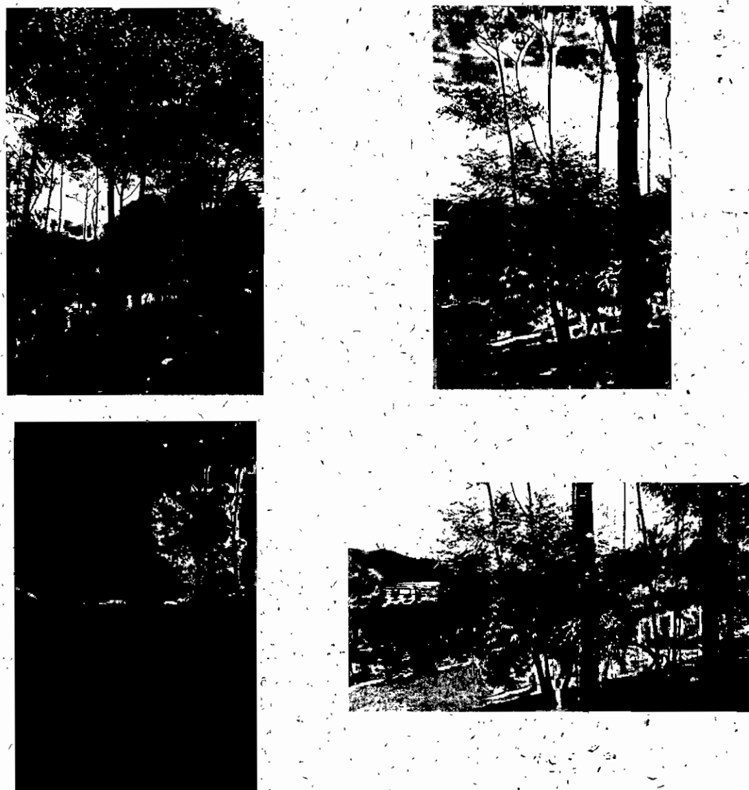
Figura 1. Registro fotográfico árboles a intervenir.