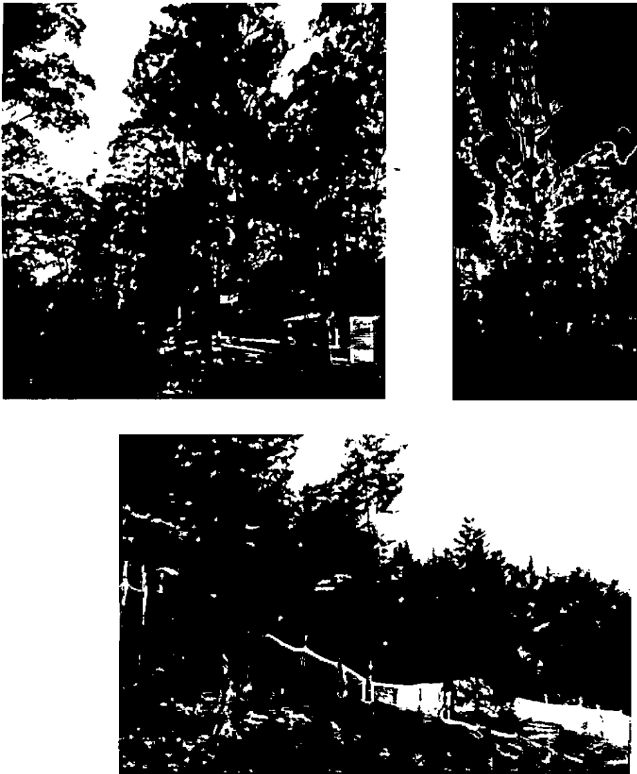
Figura 2. Registro fotográfico árboles a intervenir.