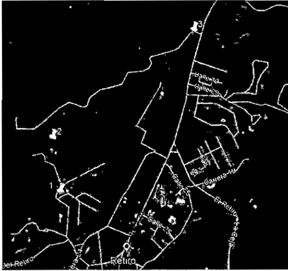
Figura 1. Ubicación Árboles objeto de intervención

3.2 Los árboles objeto de intervención presentan buenas condiciones físicas y sanitarias, la mayoría corresponden a individuos adultos, sin embargo los Cipres ( Cupressus lusitanica ) se encuentran en estadios juveniles, ninguno pertenecen a especies forestales catalogadas en grado de amenaza (CITES, UICN acuerdos corporativos), ni vedas de tipo regional y nacional.