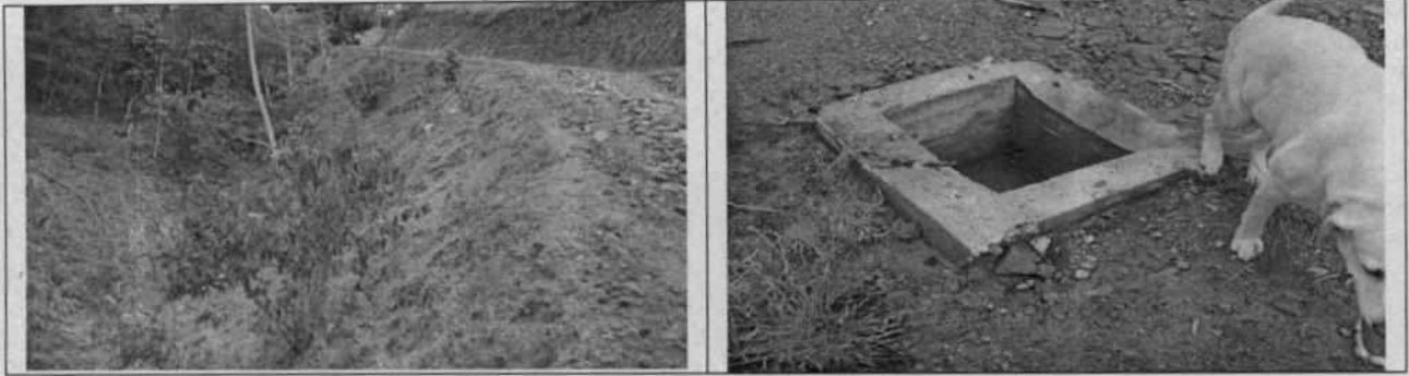
Figura 1. Obras transversales y cobertura vegetal

Así mismo se observó revegetalización de zonas expuestas con la siembra de pastos y regeneración natural de rastrojos bajos, además de la siembra de individuos nativos (drago y camargo) con alturas entre 0.20 m a 0.30 m a lo largo del talud”.