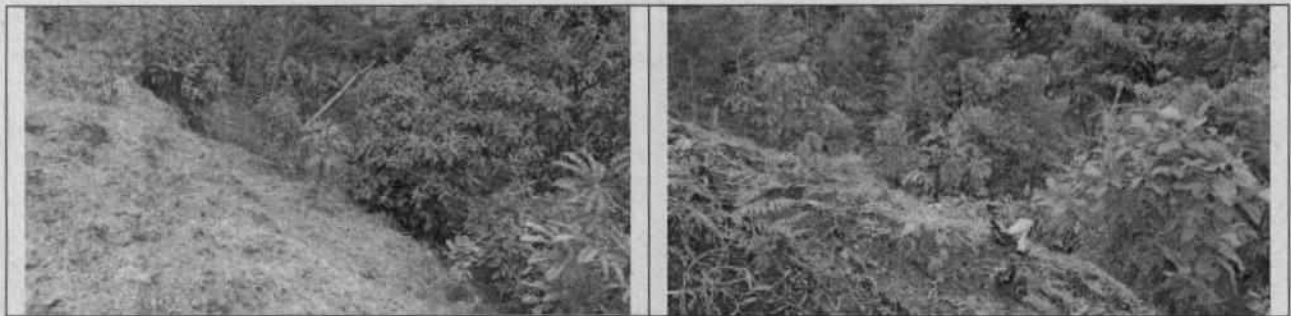
Figura 2. Coberturas vegetales

Así mismo se observó revegetalización de zonas expuestas con la siembra de pastos y regeneración natural de rastrojos bajos, además de la siembra de individuos nativos (drago y camargo) con alturas entre 0.20 m a 0.30 m a lo largo del talud”.