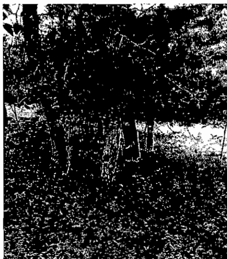
Regeneración con Pino Pátula