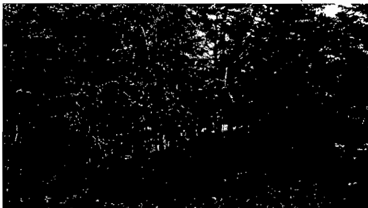
Regeneración con Ciprés