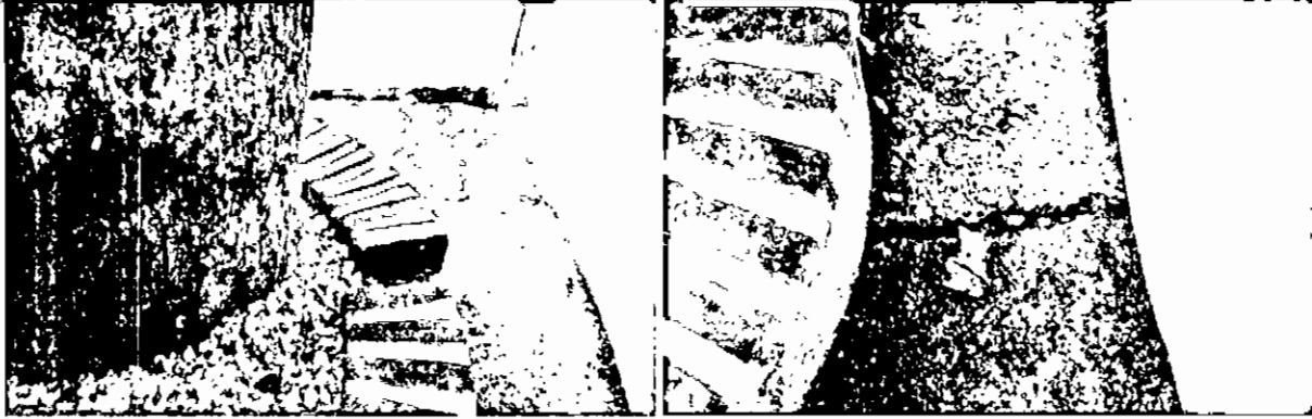
Fracturas del suelo