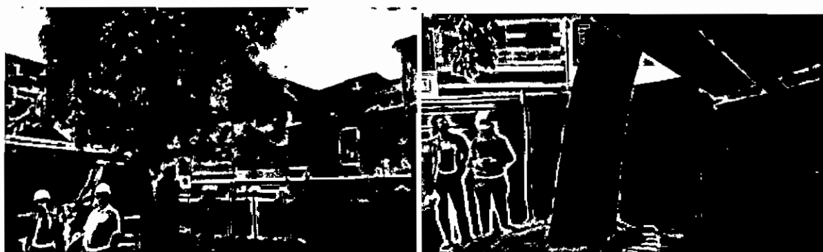
Guayacán inclinado desde la base del fuste con proyección a estructuras urbanas.