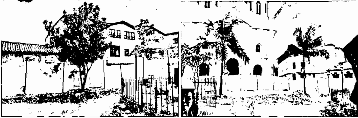
Especies aisladas de carácter ornamental