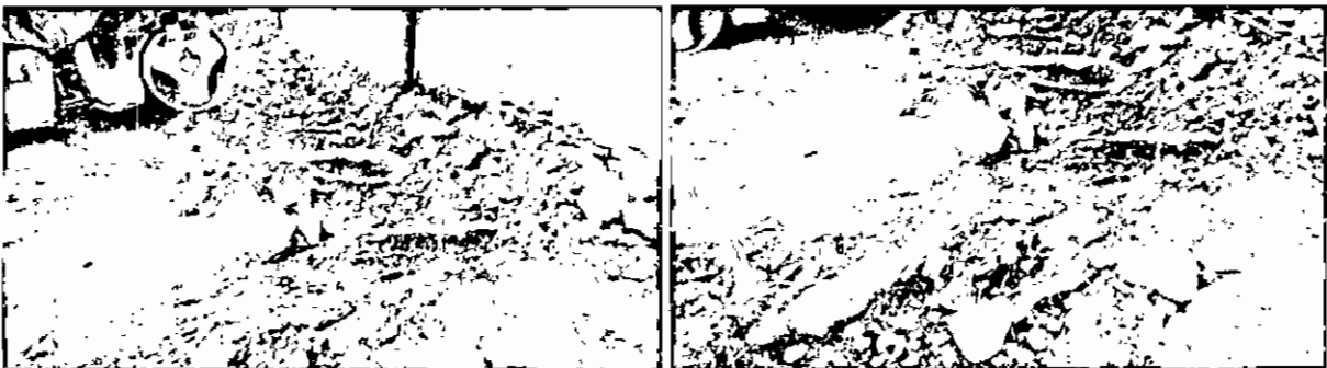
Raíces secundarias expuestas con pérdida de anclaje