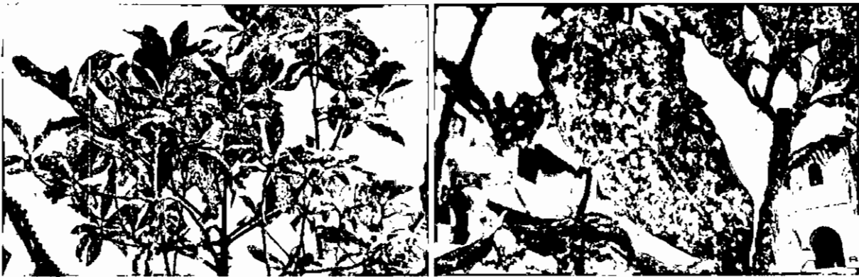
Infección por ectoparásitos (Artrópodos Aphinidos), hongos y bacterias.