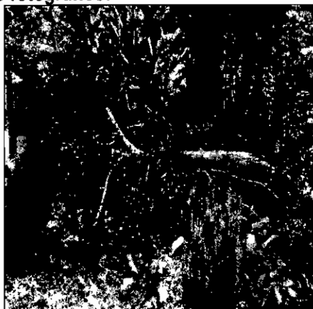
Sitio de disposición de residuos forestales.