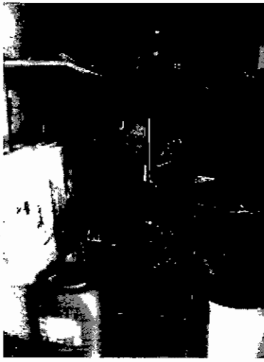
Imagen 3. Cuarto de macromedidor y motobomba