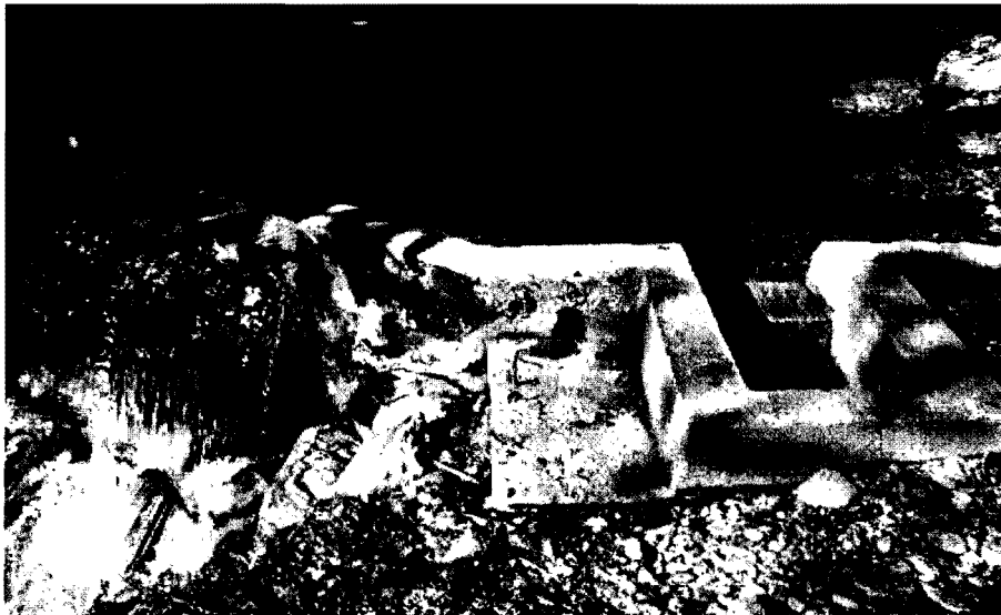
Fotografía 1 Obra de control de caudal Truchera

Obra de control de caudales en las fuentes Arrayanes y Aguilar, para un caudal de 45.0 \text{ l/s} , con diseños aprobados en la resolución que otorga la concesión, consistentes en un vertedero rectangular de pared gruesa y sistema de rebose que regresa el excedente a la fuente por medio de un vertedero y canal en concreto, además a la salida de los estanques de la truchera tiene un vertedero rectangular en donde se puede verificar el caudal utilizado en los estanques, y cumple de manera exacta con los diseños acogidos por la corporación: