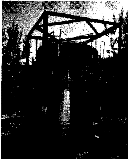
Fotografía 3 Tanque de almacenamiento.

El interesado esta implementación de caídas de agua, resaltos hidráulicos y el uso de oxígeno líquido (ya cuenta con toda la red necesaria para su uso), en avaceal plan quinquenal, ya que estas mejoras en la oxigenación reducen el uso de agua, además de mejorar las condiciones del agua a la salida de los estanques de la truchera.