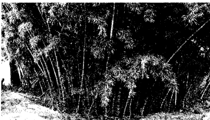
Rodal de guadua ( Guadua angustifolia ) objeto de aprovechamiento.

j. Superficie del área de aprovechamiento de flora silvestre guadua ( Guadua angustifolia ).