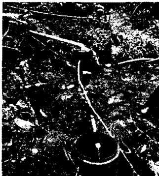
Fotografía 1 Tanques Obra de control de caudales