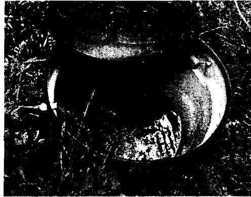
Fotografía 3 Tanque de almacenamiento, sitio de aforo

Otras situaciones encontradas en la visita: N/A