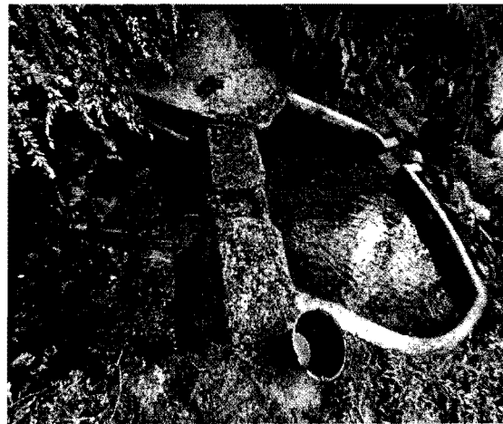
Fotografía 1 Dique de captación