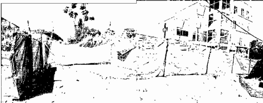
Foto 3 y 4: lugar donde se encontraban los arboles solicitados para aprovechar