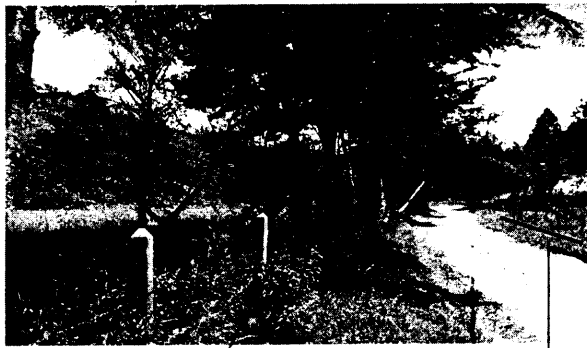
Vía actual, antiguo camino real