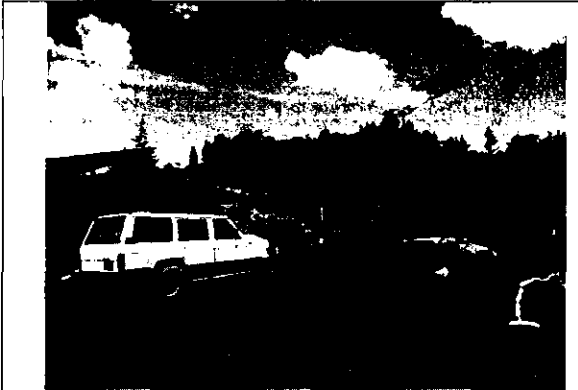
Foto 5. Se muestra el talud conformado con las actividades corte de tierra realizado. En la parte superior del talud, se observan las coberturas vegetales nativas, similares a las que fueron eliminadas para la conformación del terreno.