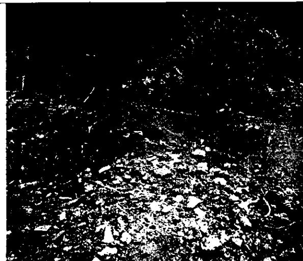
Foto 3. Se observan los surcos formados por la escorrentía superficial en los taludes conformados con las actividades de movimientos de tierra.