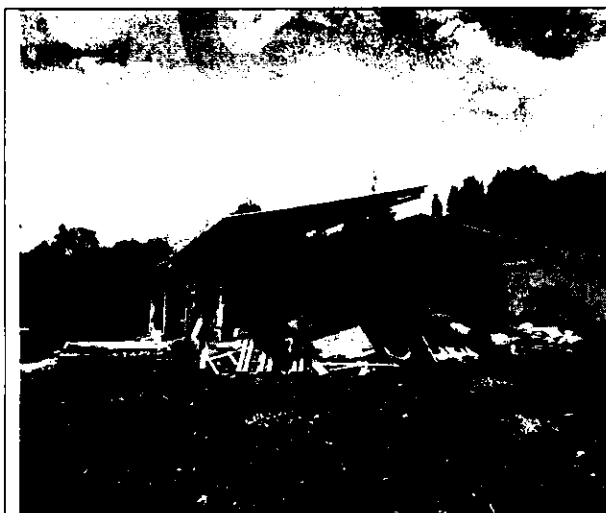
Foto 1. Se observa la construcción en obra negra.