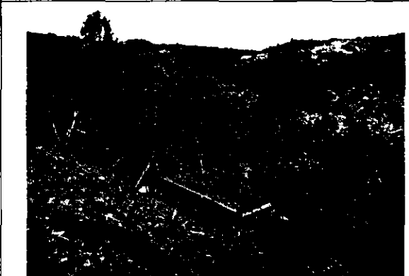
Foto 7. Se muestra el muro de contención en tierra armada que se viene conformando.