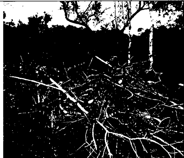
Foto 4. Residuos vegetales, producto de la intervención al recurso flora que se encontraba en el sitio donde se conformó la explanación.