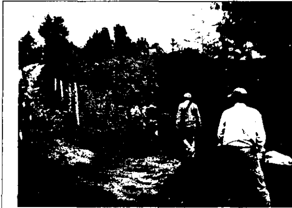
Foto 3. Se muestra la vía que fue adecuada para ingresar a la zona donde se viene construyendo la vivienda.