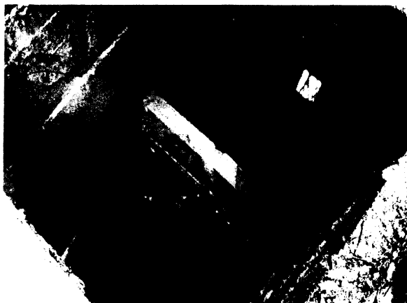
Fotografía 2. Interior de las cajas desarenadoras