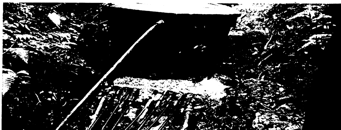
Fotografía 3. Tanque de reparto