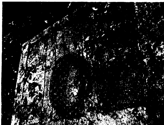
Fotografía 1. Cajas desarenadoras