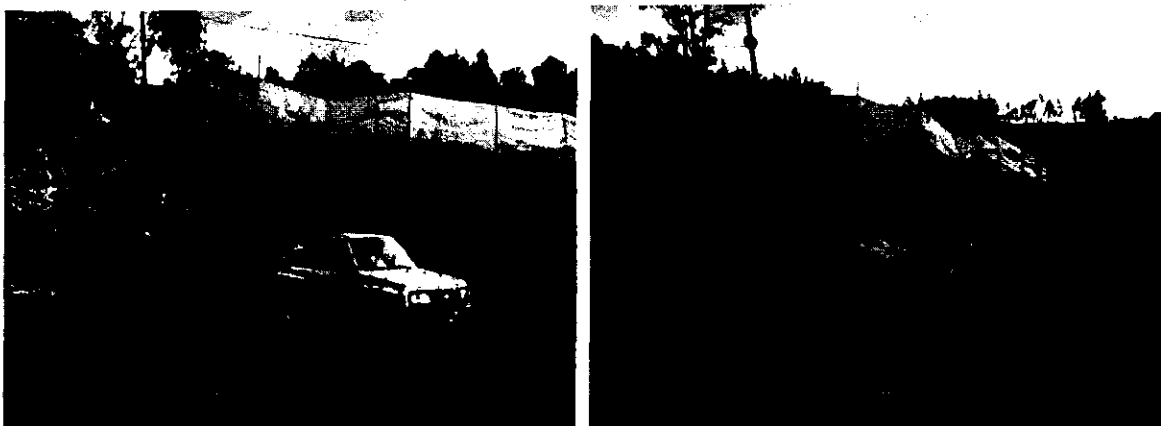
Ilustración 3- Corte en talud e inestabilidad de la banca vial.