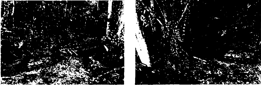
Ilustración 2- Sedimentos en el lecho de fuente hídrica Chuscalito.