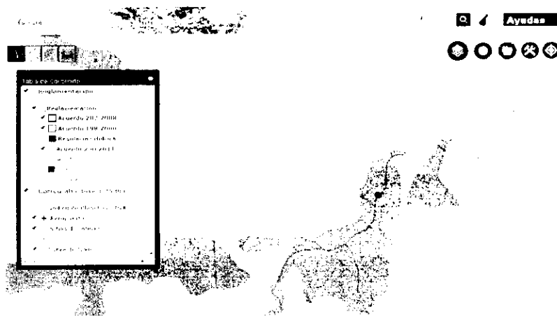
Ilustración 1- Polígono del movimiento de tierra