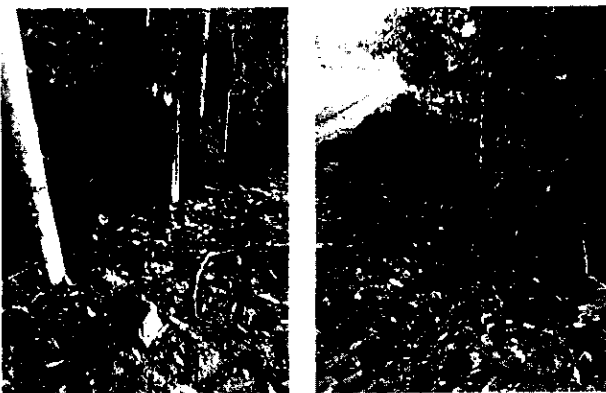
Ilustración No.3- Movimientos de tierra que invaden y afectan la ronda de protección y la fuente hídrica.