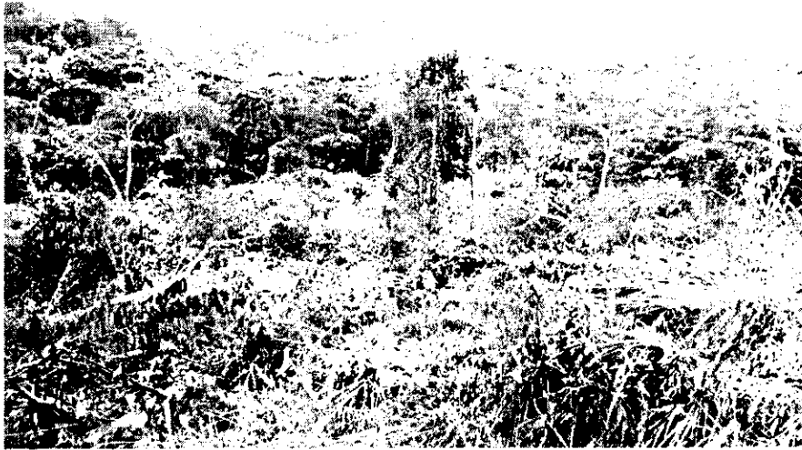
Imagen No. 2: fotografía año 2012, se evidencia la presencia de bosque en el predio y fuentes de agua que lo cruzan.