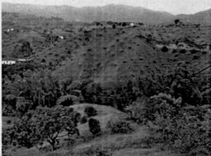
Bosque de guadua de galería o ripario.