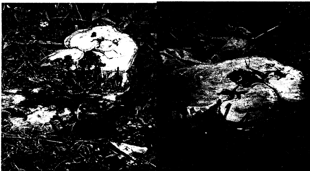
Fotografías 1 y 2: tocones de los árboles talados donde se evidencia problema fitosanitarios.