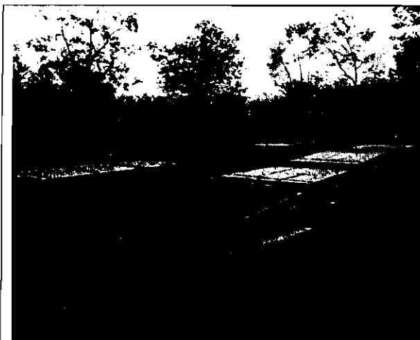
Vista general de los STARS. A la izquierda el sistema de La Reserva y a la derecha de Casa de Campo