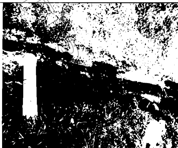
La tubería de la izquierda corresponde a la descarga de Casa de Campo y la de la derecha a la descarga de La Reserva