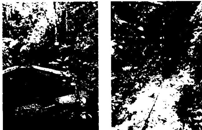
Imagen 3- Obras hidráulicas acueducto La Almería (Bocatoma)