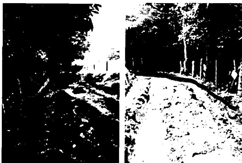
Imagen No.4 - Zona limítrofe de vía servidumbre con fuente abastecedora acueducto.