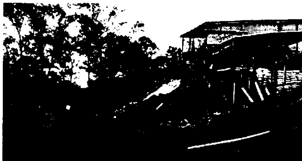
Predio intervenido con el depósito de material (13/08/2015 y 17/11/2015)