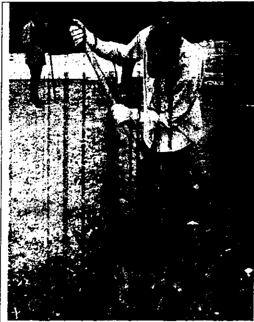
Excavación de zanja