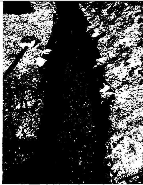
Zanja finalizada con geotextil y material filtrante