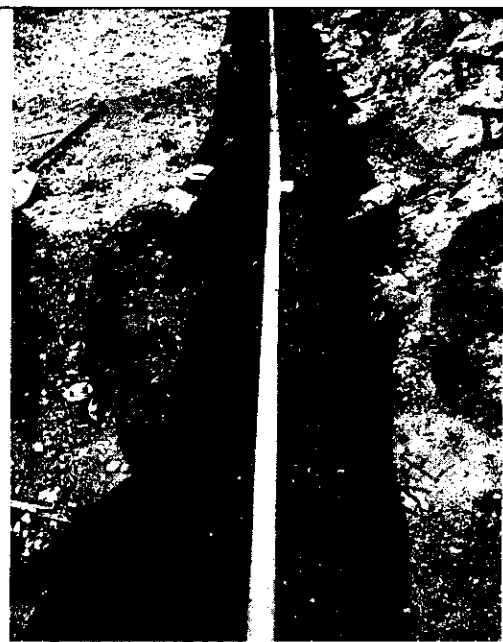
Zanja con tubería perforada