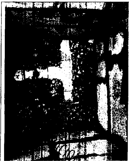
Válvulas del doble paso al campo