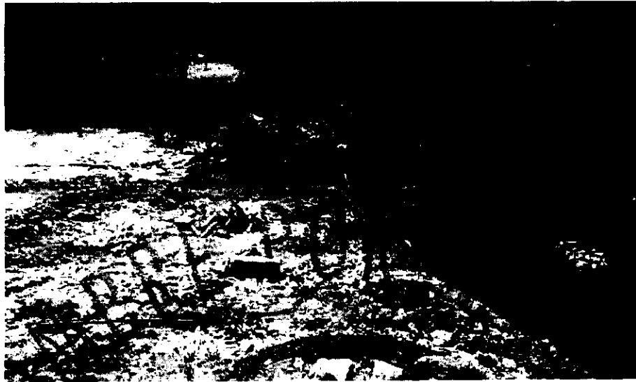
Figura 3. Material del lleno antrópico y animales en la zona

Teniendo en cuenta el Acuerdo 250 de 2011, en el sitio no se están llevando a cabo los usos establecidos en el Artículo sexto”.