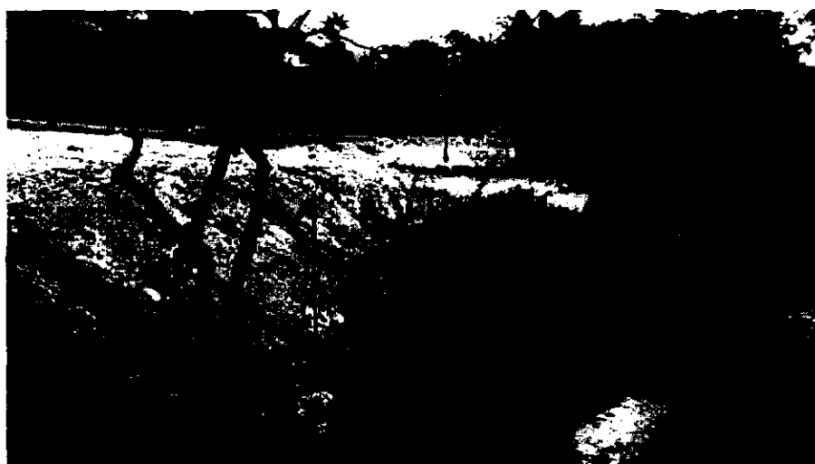
Figura 2. Intervención del cauce de la quebrada La Marinilla