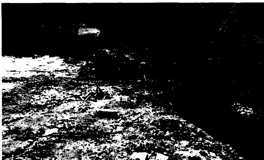
Figura 1. Material del lleno antrópico y animales en la zona