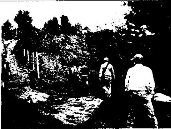
Foto 3. Se muestra la vía que fue adecuada para ingresar a la zona donde se viene construyendo la vivienda.