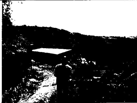
Foto 4. Se muestra el área donde se adecuó la explanación y donde se viene construyendo una vivienda sin licencia del Municipio.