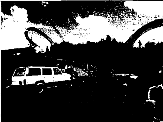
Foto 5. Se muestra el talud conformado con las actividades corte de tierra realizado. En la parte superior del talud, se observan las coberturas vegetales nativas, similares a las que fueron eliminadas para la conformación del terreno.