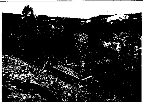
Foto 7. Se muestra el muro de contención en tierra armada que se viene conformando.