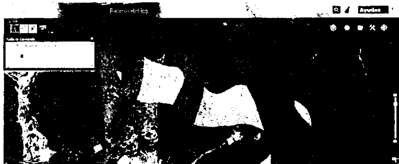
Imagen 1. Se muestra la zona donde se realizaron las intervenciones y donde actualmente se encuentran construyendo una vivienda. Según el Acuerdo de Cornare 250 de 2011, corresponde a Zona de Protección Ambiental.