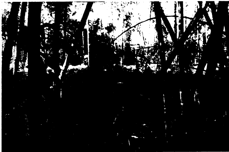
Ilustración 1 Detalle del punto de medición

Con el fin de dar atención a las solicitudes de los usuarios interesados, y de cuantificar las condiciones normales de operación de la fuente emisora de ruido, no se ingresó para éste momento a la empresa ni se avisó del monitoreo a realizar.