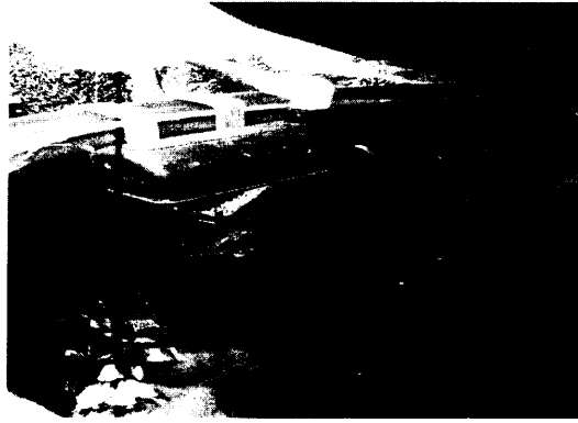
Fotografía 1. Obra de Derivación y Control de caudal Fotografía 2. Flotador como medida de ahorro y uso eficiente del agua

Se realizó aforo volumétrico a la entrada del tanque de control de caudal, el cual arrojó 0.011 L/seg, para uso doméstico, pecuario y riego en beneficio del predio con FMI: 018-24691, ubicado en la vereda La Chapa del Municipio de El Carmen, dando como resultado el caudal otorgado por la Corporación para esta fuente de forma individual.