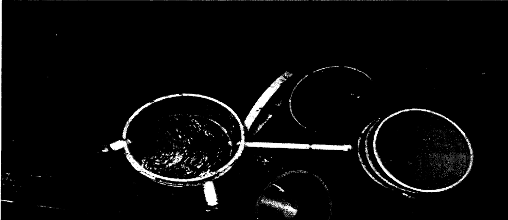
Fotografía 1. Obra de Derivación y Control de caudal

La interesada implementó la obra de captación y control de caudal, diseños que fueron entregados por Comare, "Obra Económica" requerida dentro de la Acto Administrativo que otorgó la concesión de aguas, Resolución 131-0072 del 07 de Febrero de 2017 en la fuente El Salto ( Captación numero 3) vereda San Isidro del municipio de Guame, dicha obra fue construida en un sitio con coordenadas X: -75^{\circ} 28' 28.5'' , Y: 06^{\circ} 17' 36.6'' Z:2450 para un caudal total de 0.007 L/seg.