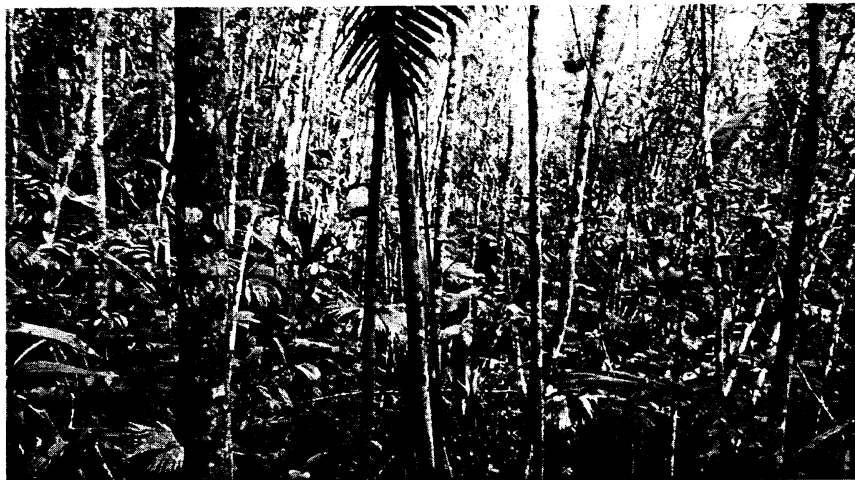
Foto 2. Especies y cantidad de árboles identificados en corona de talud zona 10

Ruta www.cornare.gov.co Apoyo Gestión Municipal Anexos Gestión Ambiental, social, participativa y transparente Nigens de sus 20-Sep-17