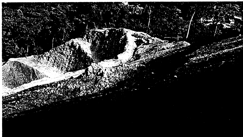
Foto 4. Zona de falla en talud de zona 10.