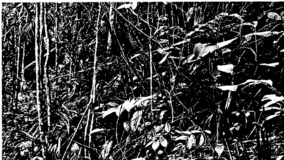
Foto 3. Marcación de límite de aprovechamiento forestal