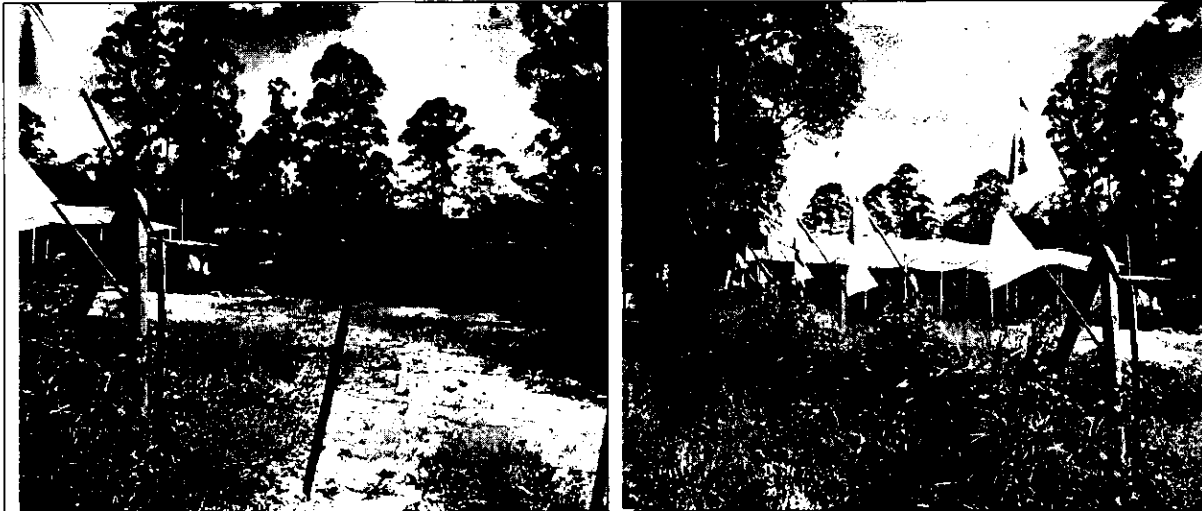
Foto 1. No se evidencia el desarrollo de la actividad económica en el predio.