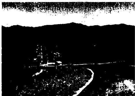
Figura 2. Pavimentación vía

Se evidenció en el recorrido que se terminaron los movimientos de tierra, y al tener terminado el puente, pavimentada la vía interna del proyecto y las obras de drenaje de aguas lluvias, se tiene control del aporte de sedimento a las fuentes hídricas que rodean el proyecto (Figuras 2, 3 y 4).