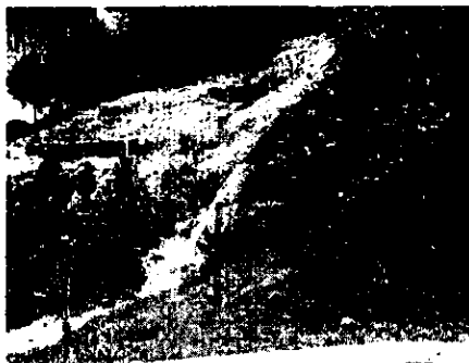
Figura 3. Protección con trinchos