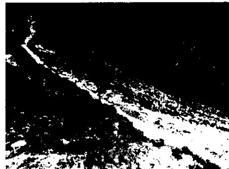
Figura 4. Cubrimiento material

Al momento de la visita se encontraban un grupo de trabajadores haciendo labores de retiro de sedimento de la fuente hídrica ubicada en el costado sur del proyecto, evidenciándose resuspensión del sedimento, además de indicar el usuario que están disponiendo en los taludes del proyecto de dicho sedimento (Figura 5).