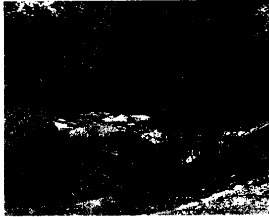
Figura 6. Aguas abajo del pontón.