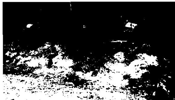
Figura 5. Algunos tocones y madera en el predio