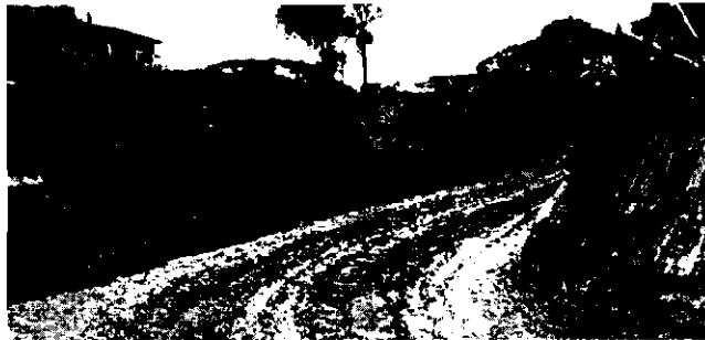
Figura 3. Apertura de vía desde la parte alta del predio