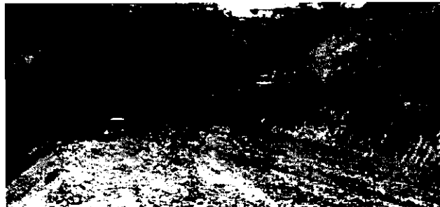
Figura 4. Maquinaria en el predio