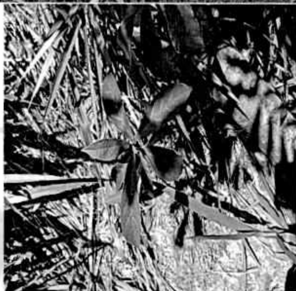
Estado actual del área perturbada y de árboles sembrados

Gestión Ambiental, social, participativa y transparente