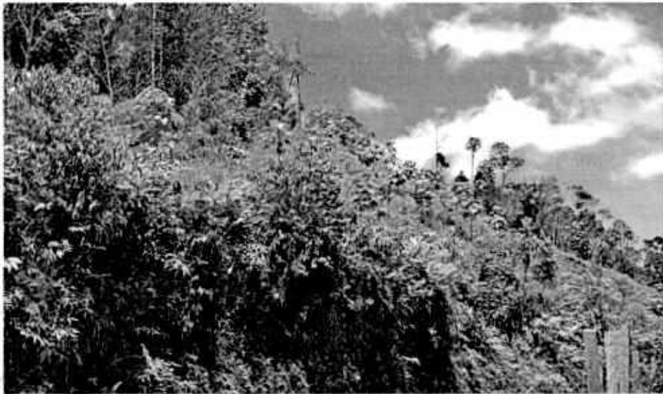
Plantación de balso ( Ochroma pyramidale ) en lugar diferente al indicado por la Corporación