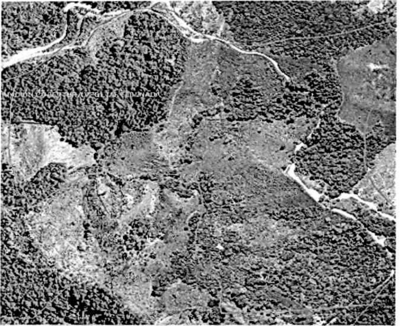
Imagen 1: ortofotografía del predio y aproximación del polígono del bosque perturbado.