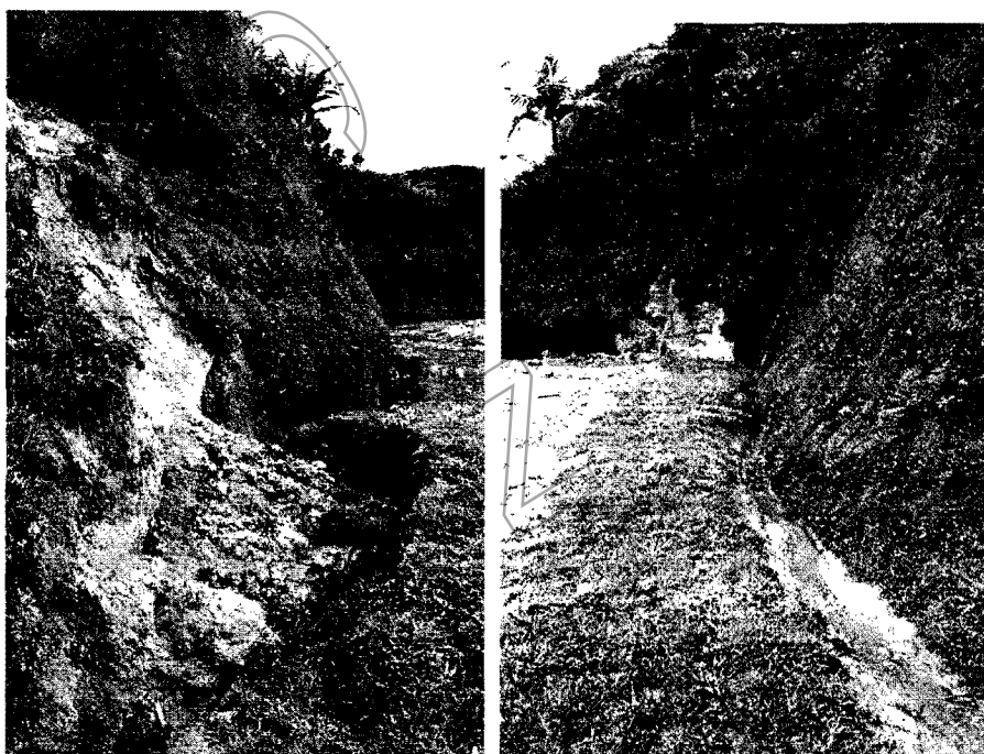
Ilustración No.4 - Fuente hídrica intervenida (recostada hacia el talud) e inestabilidad en taludes.