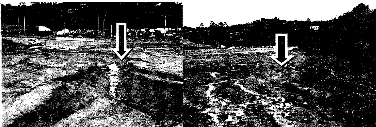
Ilustración No.3 Cárcavas y surcos considerables debido a los procesos de lluvia escorrenτία.