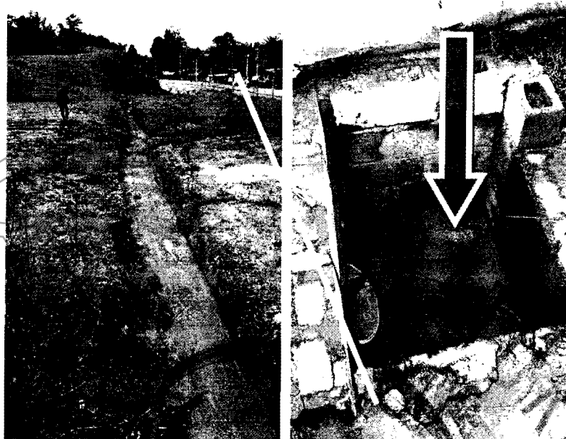
Ilustración No.5 - Canal y pocetas colmatadas y sin limpieza.