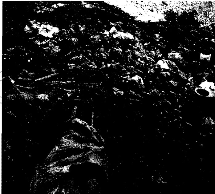
Depósito de basuras en predio de los interesados