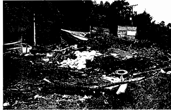
Fotografía No. 4 Llento y quemaduras