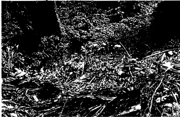
Fotografía No. 3 Llento