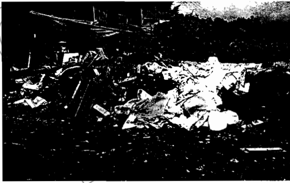
Fotografía No. 1 Deposito de material

El material de lleno es heterogéneo y no se encuentra compactado, lo que se evidencia al presentar zonas de hundimientos y erosión, adicionalmente se evidencian rastros de quemaduras en el lugar.