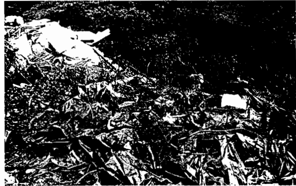
Fotografía No. 2 Deposito de material