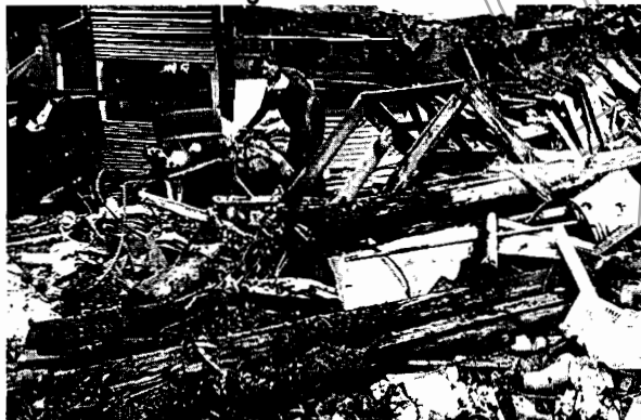
Fotografía No. 5 Depósito de material