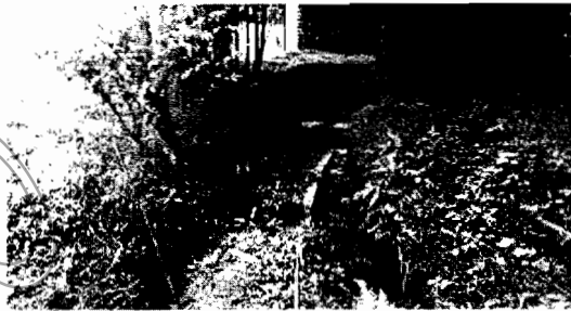
Derivación del caudal de la Quebrada La Sonadora.