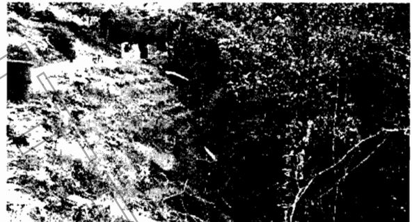
Siembra de pasto sobre el talud de lleno