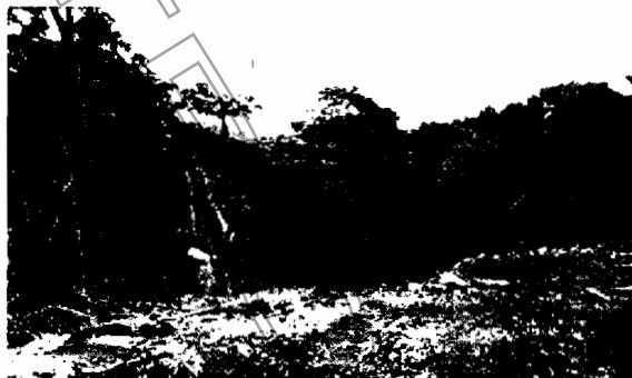
Imagen 3- Área adyacente a fuente hídrica

Que en aras de lo evidenciado en el informe técnico en mención, y de acuerdo a lo plasmado por el recurrente, es importante aclarar de nuevo, la realización del aprovechamiento forestal, sin contar con el permiso correspondiente, actividades que fueron ejecutadas en una ronda hídrica de protección ambiental, lo cual claramente se evidencia en las imágenes anteriores y en la siguiente imagen: