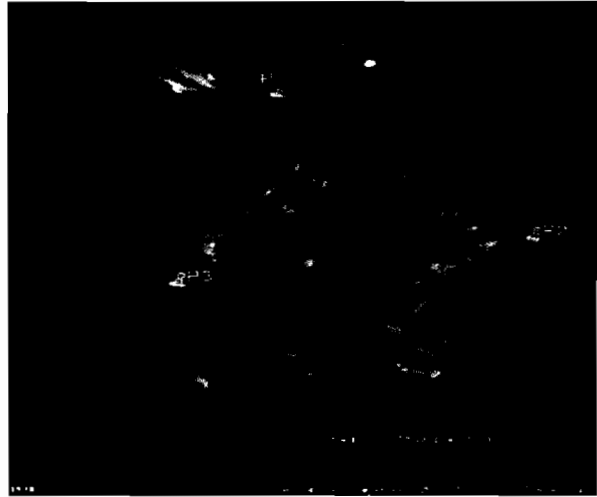
Imagen 2- Enero de 2015