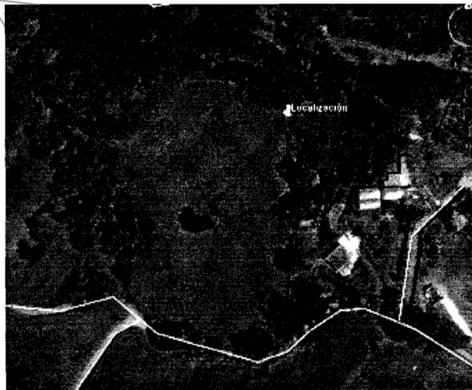
Ilustración 1- Polígono del movimiento de tierra