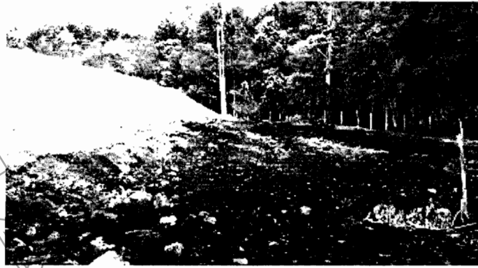
Ilustración 2- Talud adyacente a fuente hídrica