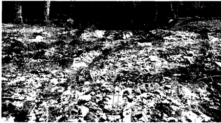
Ilustración 3- Mancha de sedimentos