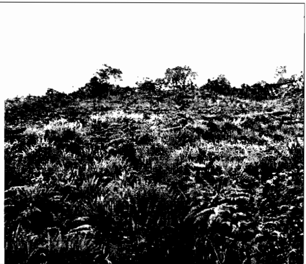
Foto No.4. En algunas zonas intervenidas con la tala, se encuentran sembradas en pasto de corte y maíz.