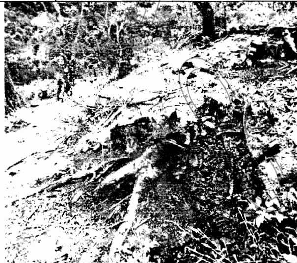
Foto No.5. Evidencia de los árboles plantados que fueron talados en el predio del señor ORREGO.