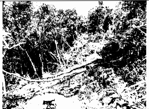
Foto No.2. Se observan árboles nativos de gran porte talados.