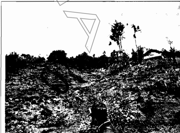
Foto No.1. Se observa el lugar donde se realizó tala rasa de bosque natural recientemente. Los residuos vegetales han venido siendo quemados