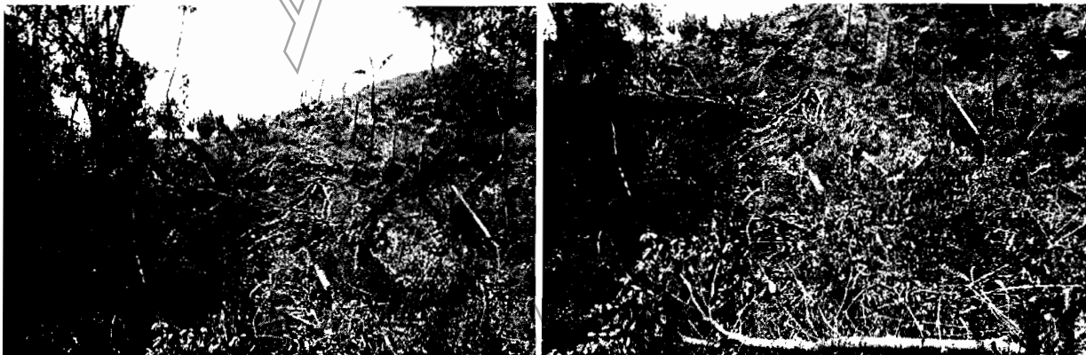
Intervención sobre el bosque natural.