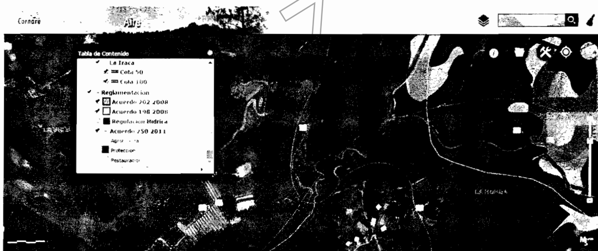
Ubicación del área de la intervención.

Que en vista de lo anterior, es claro entonces para este Despacho la intervención del bosque natural, la cual se realizó en suelo de protección ambiental y sin contar con el respectivo permiso ambiental de aprovechamiento forestal, transgrediendo así la normatividad ambiental, en predios de la investigada.