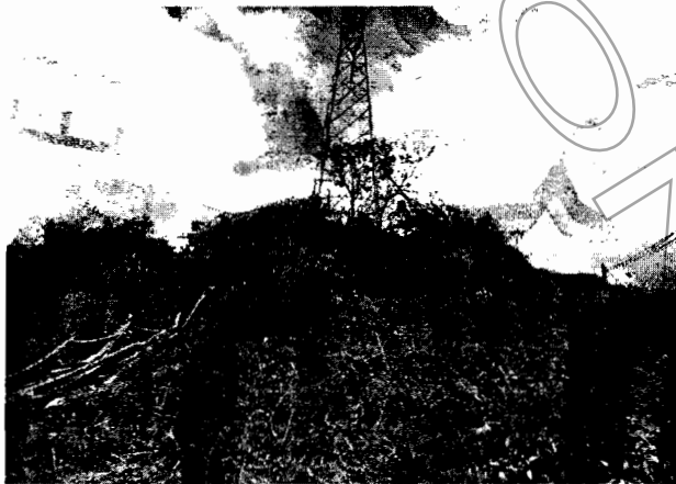
Quemas de los residuos de corte.

-Según el sistemas de información geográfico de la Corporación, el predio no presenta restricciones por zonas de protección forestal, sin embargo debe respetar los retiros a las fuentes hídricas, establecidos en el POT Municipal Mínimo 10 metros, este predio se encuentra registrado código catastral 318200100000600104. Zuleta castaño y CIA.