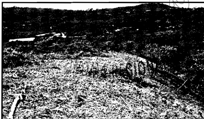
Zona colindante al área de retiro de fuentes hídricas.