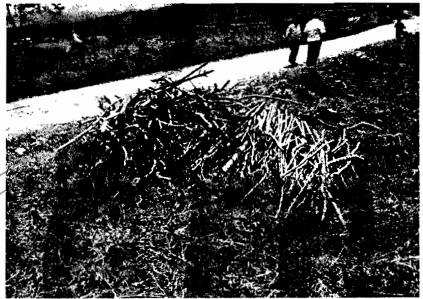
Almacenamiento de en varaderas.