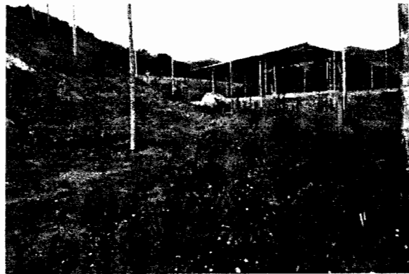
Ilustración 1- Zona de protección

Revegetar con especies nativas como quebrabarrigo o nacedero o cordoncillo, la ronda hídrica de protección, correspondiente a 30.0m a cada lado de la fuente hídrica.