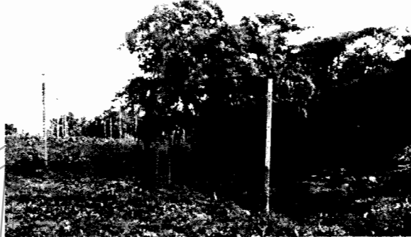
Ilustración 2- Cultivo de hortensias en APH

Abstenerse de realizar actividades en la ronda hídrica de protección.