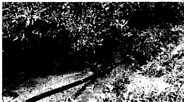
Ilustración 3- Manguera encontrada en el cauce de la fuente hídrica